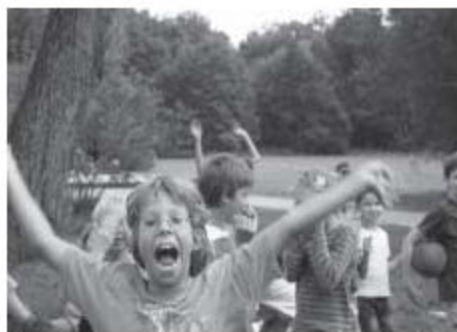
EJW Ferienspiele