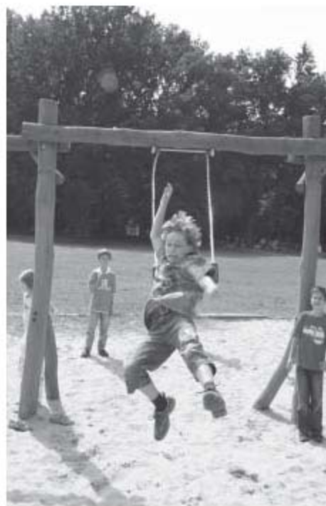
EJW Ferienspiele