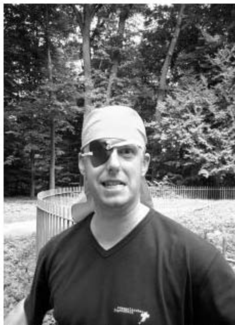
EJW Ferienspiele

Highlights der Ferienspiele waren die beiden geplanten Ausflüge zum Oberwaldhaus, von denen der erste leider ins Wasser fiel. Beim zweiten hatten wir aber tolles Wetter und konnten uns auf dem Minigolfplatz oder in Booten auf dem See vergnügen. Das absolute Highlight war aber wohl das Casino, in dem die Betreuer schick angezogen und von passender Jazzmusik begleitet den Kindern das Gefühl gaben, zur Crème de la Crème zu gehören. Und natürlich darf die Übernachtung von Donnerstag auf Freitag der letzten Woche nicht unerwähnt bleiben. Am nächsten Morgen waren zwar alle müde, erzählten aber begeistert von der Nacht-