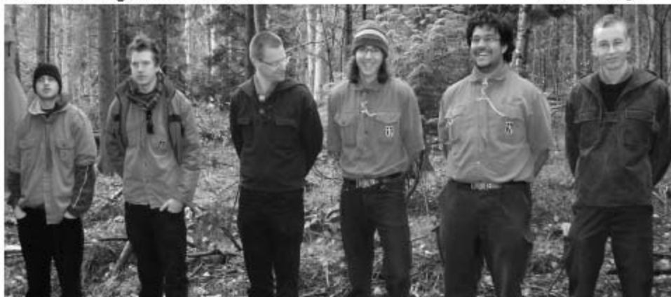
Bußtagtreffen 2007 - während der Stunde der Stämme